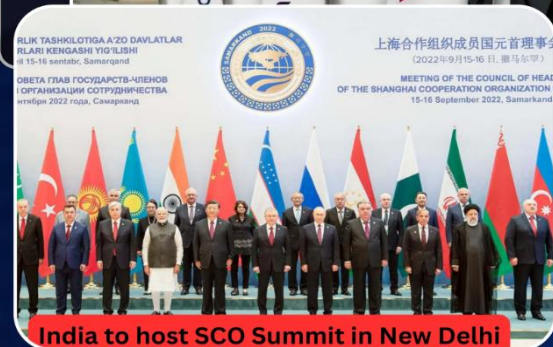
India to host SCO Summit in New Delhi