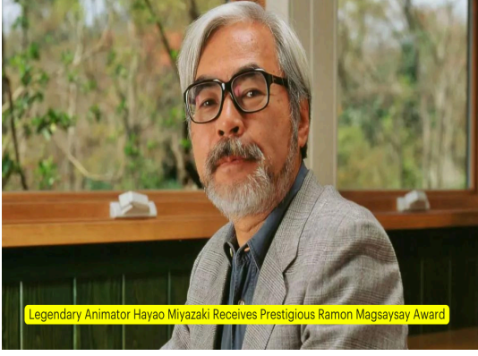
Legendary Animator Hayao Miyazaki Receives Prestigious Ramon Magsaysay Award