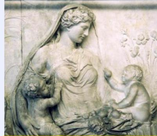
Gaia is the Greek goddess of Earth, mother of all life,

The hypothesis indicates that living organisms interact with their non-living inorganic surroundings on Earth to self-regulate the Earth environment, thus maintaining the conditions for life on the planet.