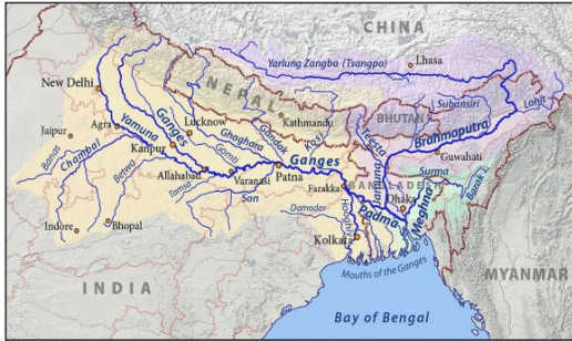
The Ganges-Brahmaputra Basin

পশ্চিমবঙ্গের মুখ্যমন্ত্রী তিস্তার বিধ্বংসী আকস্মিক বন্যায় ক্ষতিগ্রস্ত কালিম্পং-এর বাসিন্দাদের জন্য আর্থিক সহায়তা ও উদ্যোগ ঘোষণা করেছেন।