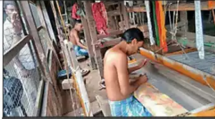
(L) Kalo Nunia rice variety; (R) Tangail weavers of Nadia

Five items that have been recognized for the GI tag | Sundarbans' natural honey, Jalpaiguri's Kalo Nunia rice and Murshidabad and East Burdwan's Garad and Korial and Nadia's Tangail sarees