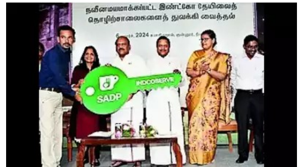
நவீனமயமாக்கப்பட்ட இண்ட்கோ தேயிலைத் தொழிற்சாலைகளைத் துவக்கி வைத்தல்

நீலகிரியில் மேலும் இரண்டு நவீனமயமாக்கப்பட்ட Indco தேயிலை தொழிற்சாலைகள் .