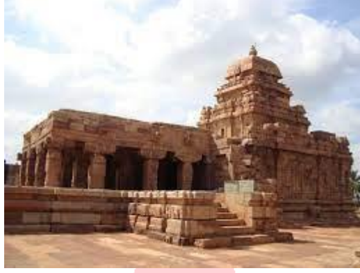
Art and Architecture of Chalukya