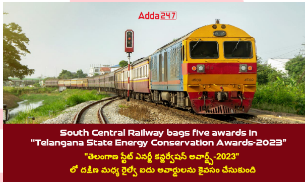
South Central Railway bags five awards in "Telangana State Energy Conservation Awards-2023" "తెలంగాణ స్టేట్ ఎనర్జీ కన్జర్వేషన్ అవార్డ్స్-2023" లో దక్షిణ మధ్య రైల్వే ఐదు అవార్డులను కైవసం చేసుకుంది

4. "తెలంగాణ స్టేట్ ఎనర్జీ కన్జర్వేషన్ అవార్డ్స్-2023"లో దక్షిణ మధ్య రైల్వే ఐదు అవార్డులను కైవసం చేసుకుంది.