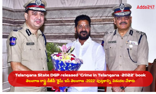
Telangana State DGP released 'Crime in Telangana -2022' పుస్తకాన్ని అదనపు డిజి సిఐడి మహీష్ ఎం భగవత్ మరియు ఇతర అధికారుల సమక్షంలో విడుదల చేశారు. 2021తో పోలిస్తే 2022లో సైబర్ నేరాలు 48.47 శాతం పెరిగాయి. ఆర్థిక నేరాలు 41.37 శాతం పెరిగాయి మరియు మోసానికి సంబంధించిన నేరాలు 43.30 శాతం పెరిగాయి.

డిసెంబరు 19, 2023న డైరెక్టర్ జనరల్ ఆఫ్ పోలీస్ తెలంగాణ, రవి గుప్తా 'క్రైమ్ ఇన్ తెలంగాణ -2022' పుస్తకాన్ని అదనపు డిజి సిఐడి మహీష్ ఎం భగవత్ మరియు ఇతర అధికారుల సమక్షంలో విడుదల చేశారు. 2021తో పోలిస్తే 2022లో సైబర్ నేరాలు 48.47 శాతం పెరిగాయి. ఆర్థిక నేరాలు 41.37 శాతం పెరిగాయి మరియు మోసానికి సంబంధించిన నేరాలు 43.30 శాతం పెరిగాయి.