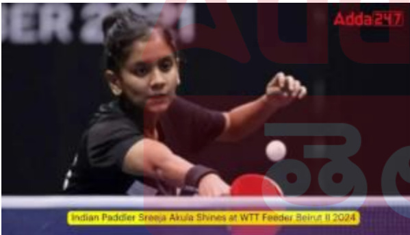
Indian Paddler Shreeja Akula Shrinet at WTT Feeder Beirut II 2024

WTT ఫీడర్ బీరుట్ II 2024లో గెలిచిన భారత క్రీడాకారిణి శ్రీజ అకుల