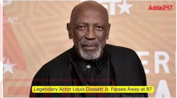
Legendary Actor Louis Gossett Jr. Passes Away at 87