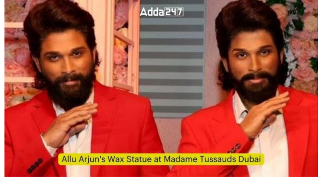
Allu Arjun's Wax Statue at Madame Tussauds Dubai

దుబాయ్ లోని మేడమ్ టుస్సాడ్స్ లో అల్లు అర్జున్ మైనపు విగ్రహం