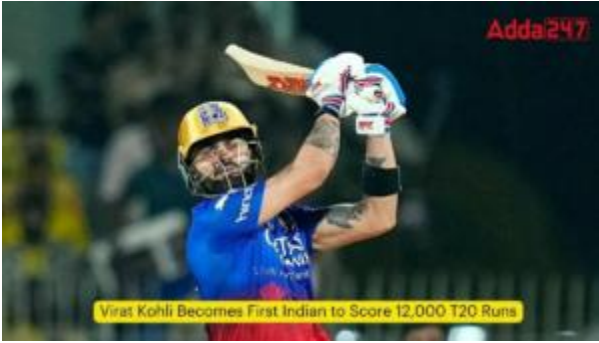
Virat Kohli Becomes First Indian to Score 12,000 T20 Runs

టీ20లో 12,000 పరుగులు చేసిన తొలి భారతీయుడిగా విరాట్ కోహ్లా నిలిచాడు