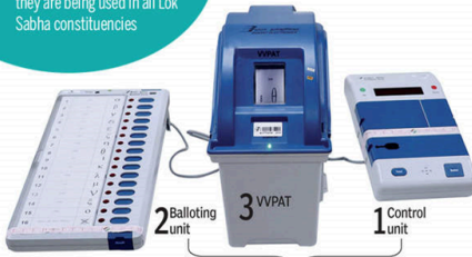
1 & 2 are joined by a cable. Taken together, the system is called EVM

VVPATs were used in eight constituencies during the 2014 general election as a pilot project. This is the first time they are being used in all Lok Sabha constituencies