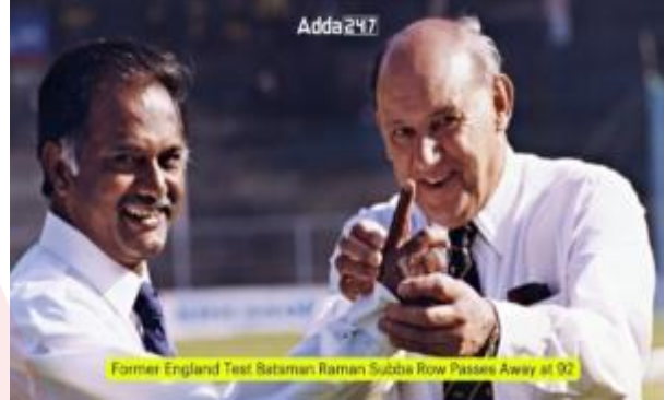
Former England Test Batsman Raman Subbiah Row Passes Away at 92

ఇంగ్లాండ్ మాజీ టెస్ట్ బ్యాట్స్మెన్ రామన్ సుబ్బారావు 92 వద్ద కన్నుమూశారు